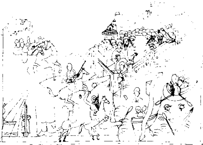
Рис. 1. Розпис «Облога Царгороду», храм св. Петра на Преслі, бл. 1360 р.

логи Царгороду» вважає ілюстрацією пізнішого вступу — кондака «Взбранной воеводи», що втілює ідею «відображення ідеї покровительства Богородиці над візантійською столицею» [7].